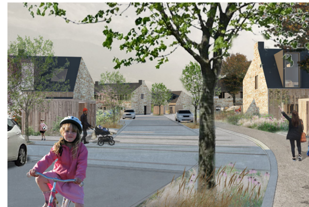
Nye boliger ved Kavsbjerggård

Skousbo er Viby's største boligudbygningsområde med en kapacitet på ca. 430 boliger i Kommuneplan 2019. På den lange bane skal Skousbo udvikle sig til en urban, grøn og bæredygtig bydel med plads til i alt 950 nye boliger. Udviklingen sker i takt med, at kommuneplanen åbner op for nye udbygninger. I overensstemmelse med helhedsplanen for Skousbo er der fokus på at skabe en blandet og social mangfoldig bydel med en stor variation af boformer, der kan supplere Vibys mange parcelhuse. De kommende år opføres bl.a. almene boliger, bofællesskaber for unge og ældre, senioregnede rækkehuse og selvbyggede villaer. Skousbos første etape med i alt ca. 300 boliger etableres på kommunalt ejet jord. Her anlægges Roskilde Kommune veje, fællesparkering, torve, pladser og rekreative, grønne områder i takt med, at grunde udbydes og boligenklaver skyder op. Skousbo's 2. etape placerer sig øst for etape 1 på privatejede arealer mellem Syvmosekilen og Skousbo Skov. Her etableres de kommende år 120 nye boliger, og samtidig færdiganlægges Syvmosekilens første etape med nye rekreative stier på tværs og gennem skoven. Fællesskab, blandede boligformer og nærhed til naturen er fortsat i fokus i udviklingen af Skousbo.