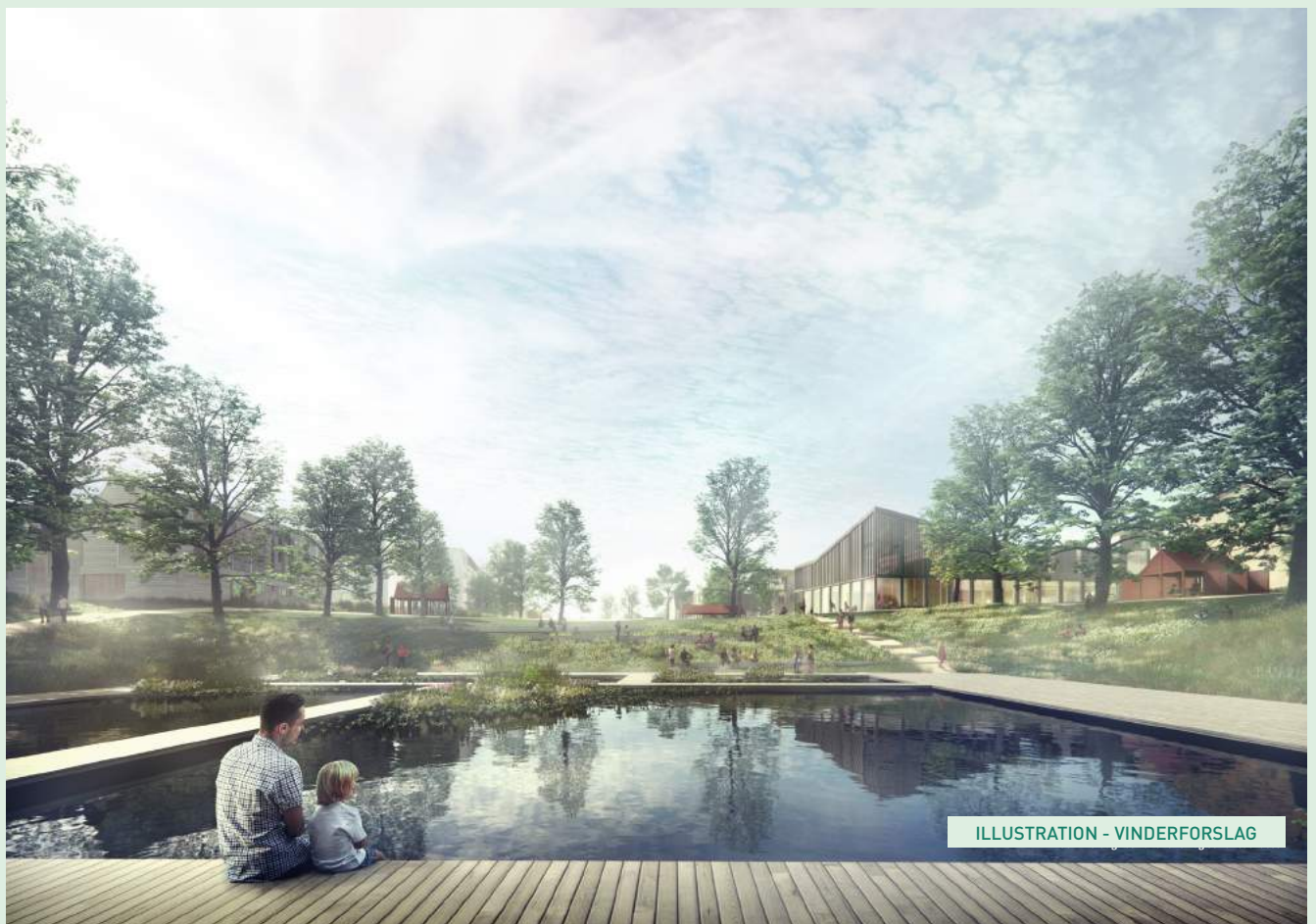
ILLUSTRATION - VINDERFORSLAG