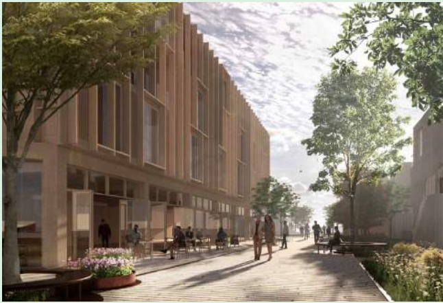
Illustration forslag 3

UNDERRÅDGIVERE: SKALA ARKITEKTER A/S (OPHAVSRET) ARKI_LAB APS RAMBØLL A/S TRAFIKPLAN APS