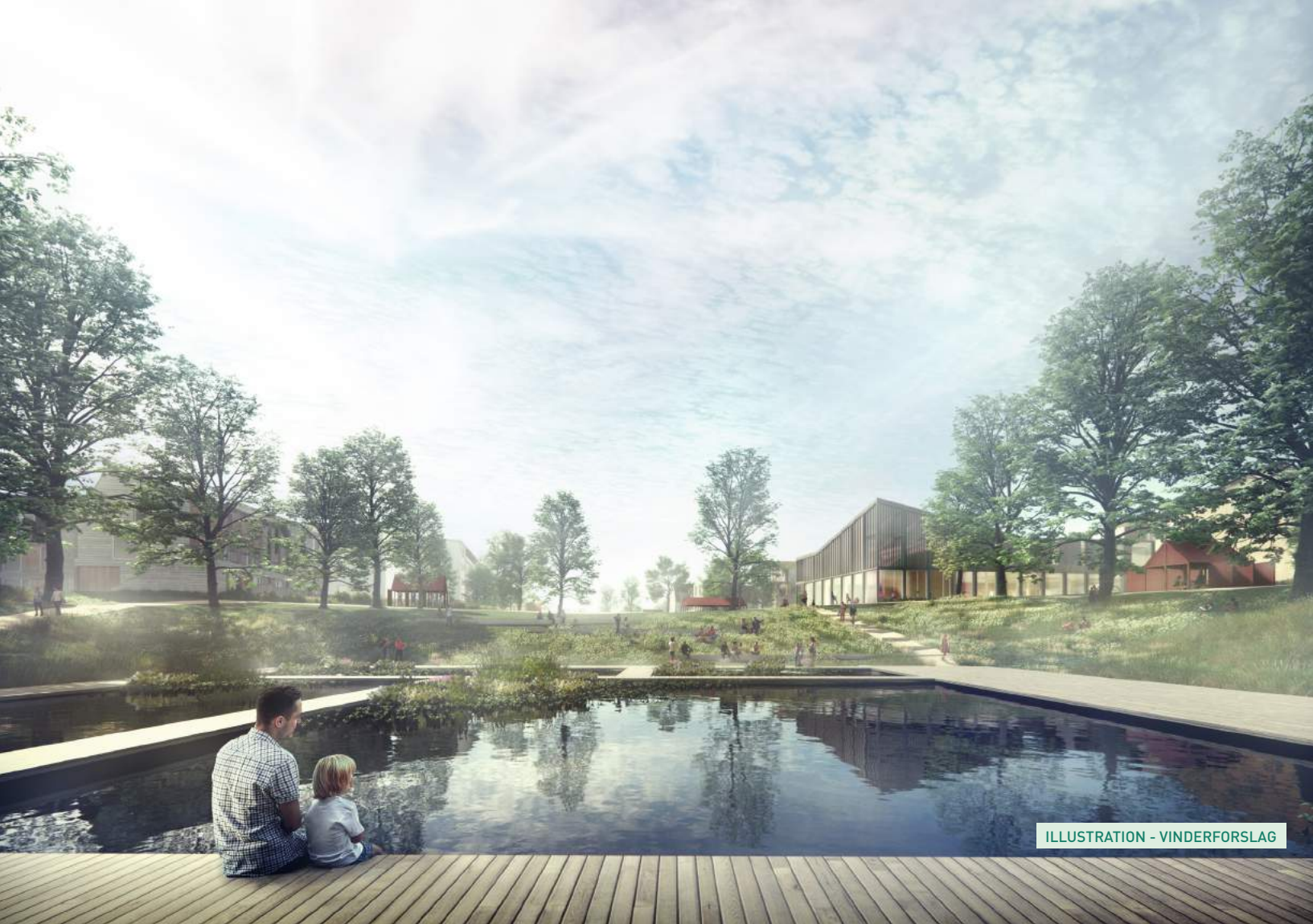
ILLUSTRATION - VINDERFORSLAG