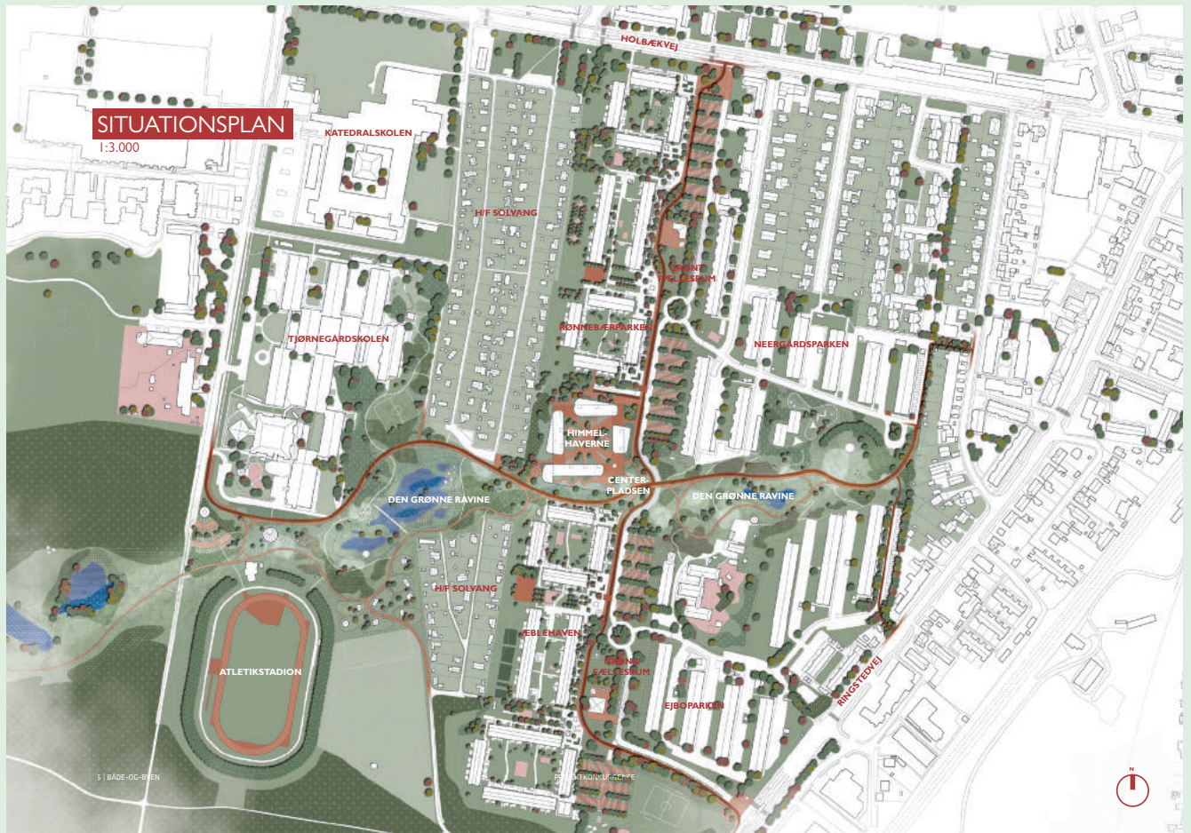
Situationsplan forslag 1 - fase 2

end de øvrige ved i høj grad at optimere områdets attraktivitetsniveau og skabe et narrativ, som tager fat i den eksisterende store skala, i landskabet og et detaljeret greb om løsningen og nedskaleringen af det trafikale forløb. Gennem de tre overbevisende delområder, Centergrunden-Himmelhaverne, Trafikforløbet-Almindingen, Parkforløbet-Den Grønne Ravine, er forslaget i sidste forhandlingsforløb igen er