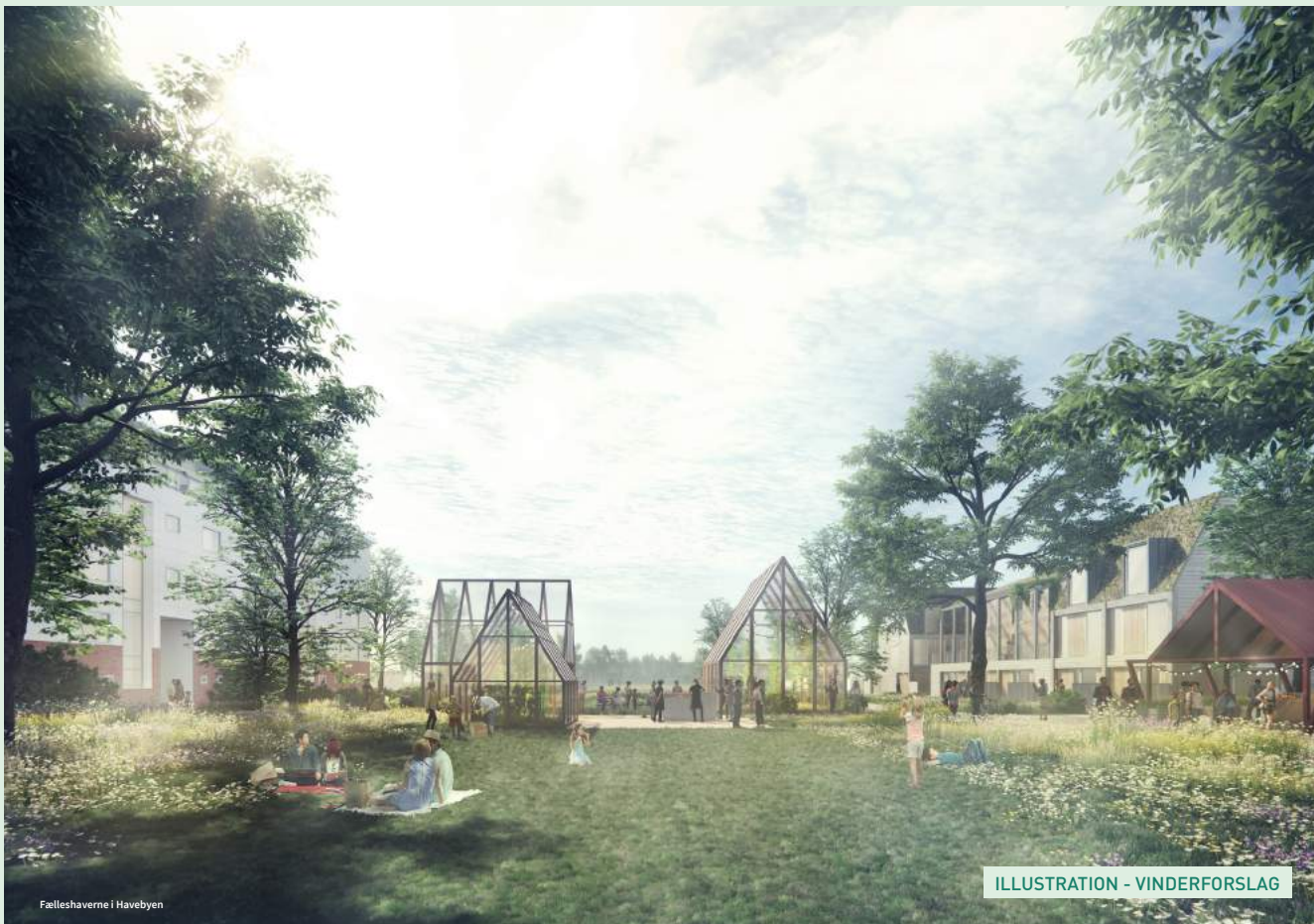
Fælleshaverne i Havebyen

En enig dommerkomité har udpeget Forslag 2, Byens Haver, som konkurrencens samlede og overbevisende vinderforslag, da den bedst tilpasser sig stedet og indfrier konkurrencekriterierne.