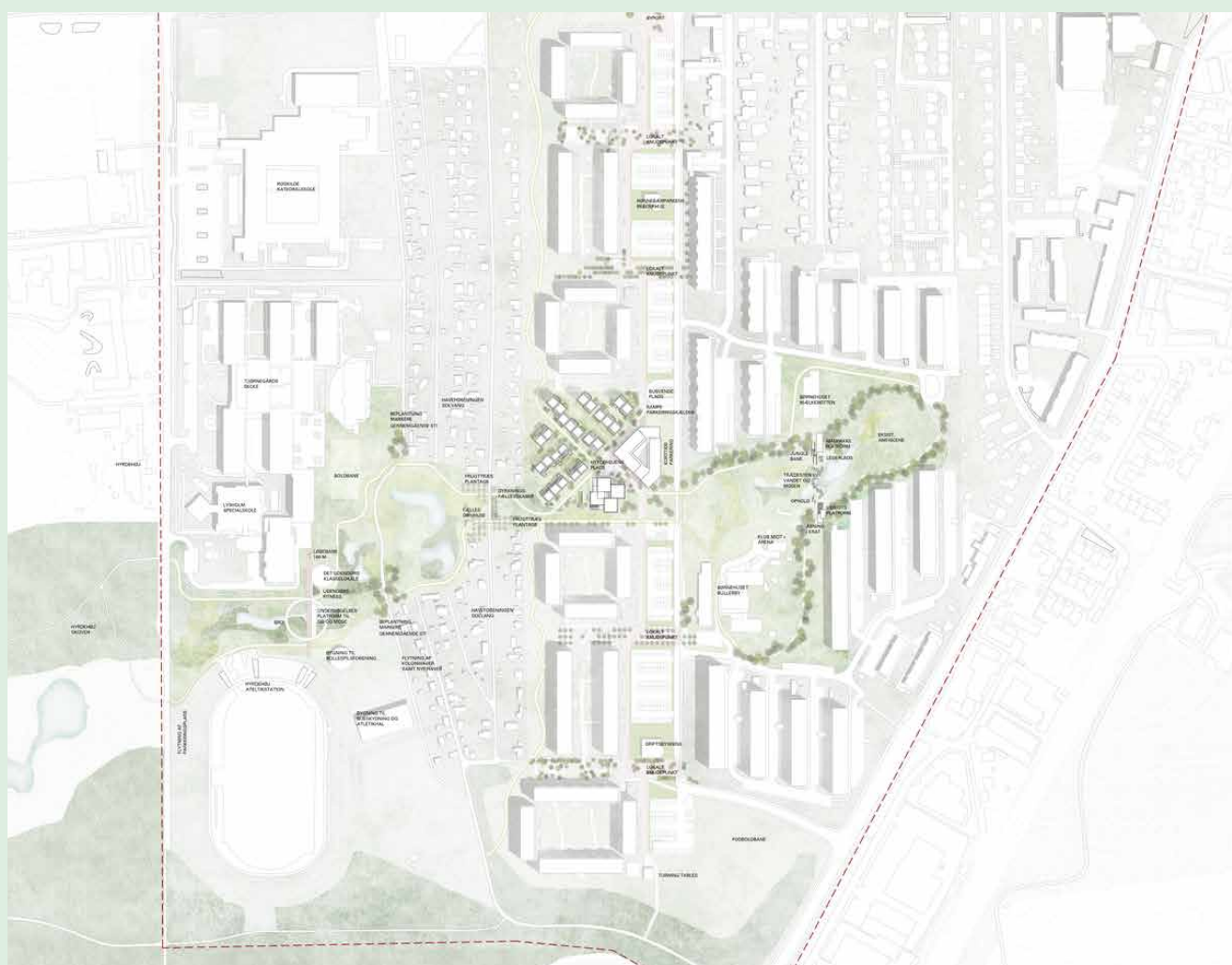
Situationsplan forslag 3

en vendseløjfe nord for Centergrunden, hvilket dommerkomitéen ikke anser som en god løsning, da der vil være for langt til Æblehaven herfra. Der er ikke redegjort for antallet af parkeringspladser med den anviste løsning.