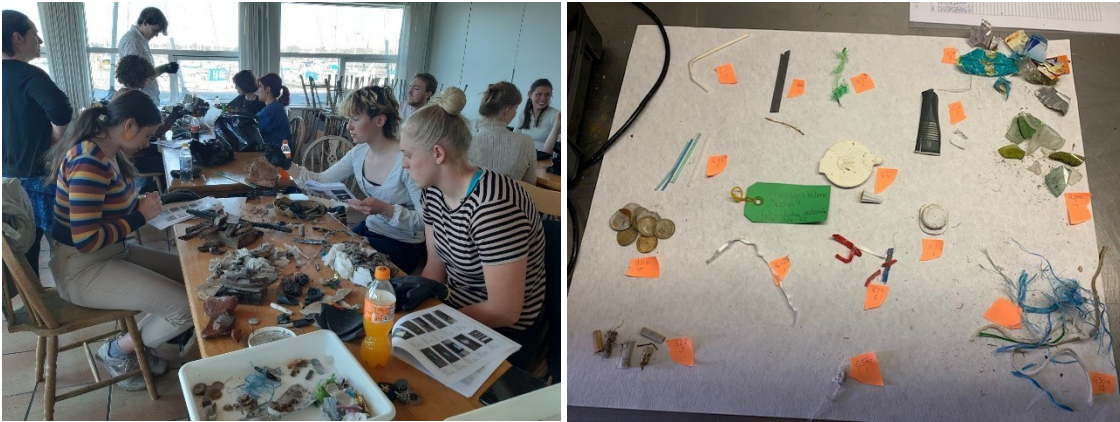
Roskilde Gymnasies elever sorterer affald

Affaldet blev sorteret sammen med Roskilde Gymnasies fritidslinje – Marin med amtet – og resultatet blev indtastet i EU's database Marine Litter Watch. Der blev indsamlet i alt 1692 affaldsgenstande på de 9 strækninger.