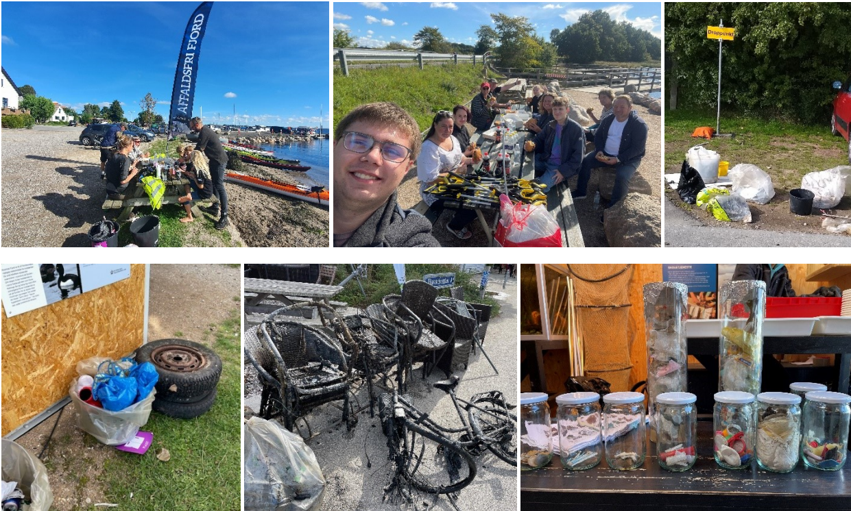
Stemningsbilleder fra strandoprydninger