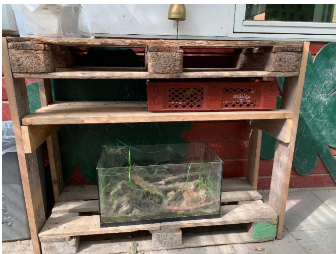
Den ene reol i Børnehaven med akvarie til snegle og insekter.

fra det de har observeret børnene er optaget af. F.eks. er der kommet biler, traktorer og gravkøer i grupperummet, hvor de store spiser, da der er et par drenge, som er enormt glade for maskiner.