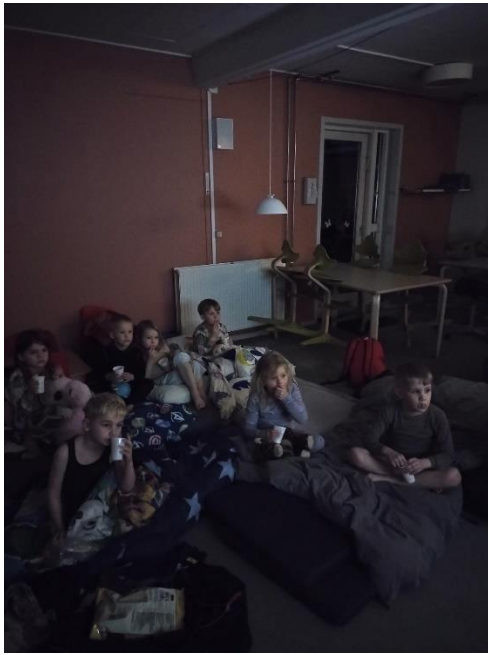
Storegruppen på overnatning i Storkereden.