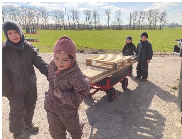
Børnene henter træ hos nogle af vores forældre.

Derudover har både FKU og en del andre forældre været en stor del i at skaffe os genbrugstræ, hvor vi både har fået noget leveret og hentet andet på besøg. Der er også en plan om en forældrelørdag, hvor en personale, forældre og børn skal forsøge at bygge legehuse af paller. Dette har FKU også været med til at planlægge og er generelt optaget af, det som vi lyser på.