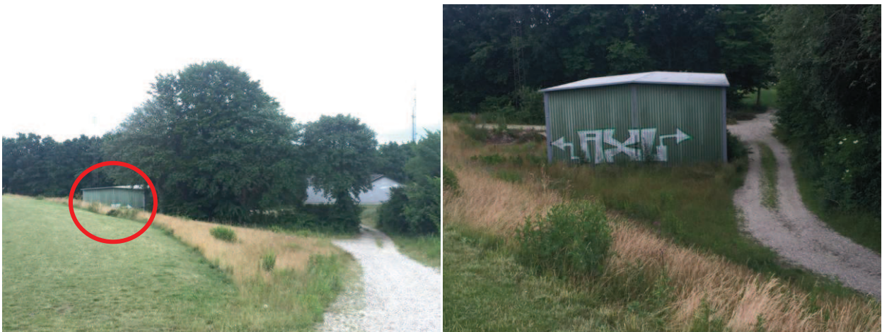
Gammel lade, nærbilleder