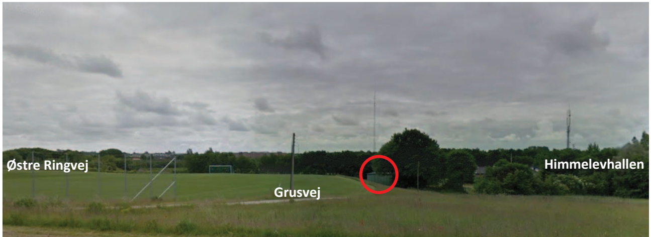
Blik mod gammel lade, set fra Herregårdsvej mod syd-øst