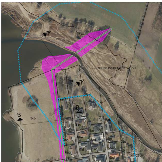
Figur 2. Fløjdige med angivelse af sluse og pumpestation, samt de nordligste 175 m. af Fjorddiget. Åbeskyttelseslinjen angivet med .....

På nedenstående kort ses Fløj- og Fjorddigets fodaftryk inden for åbeskyttelseslinjen.