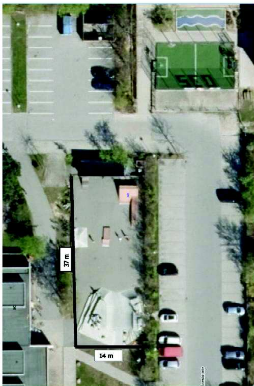
Figur 1: En reference mini skatebane i ungdomsklubben Toppen i Slingerup