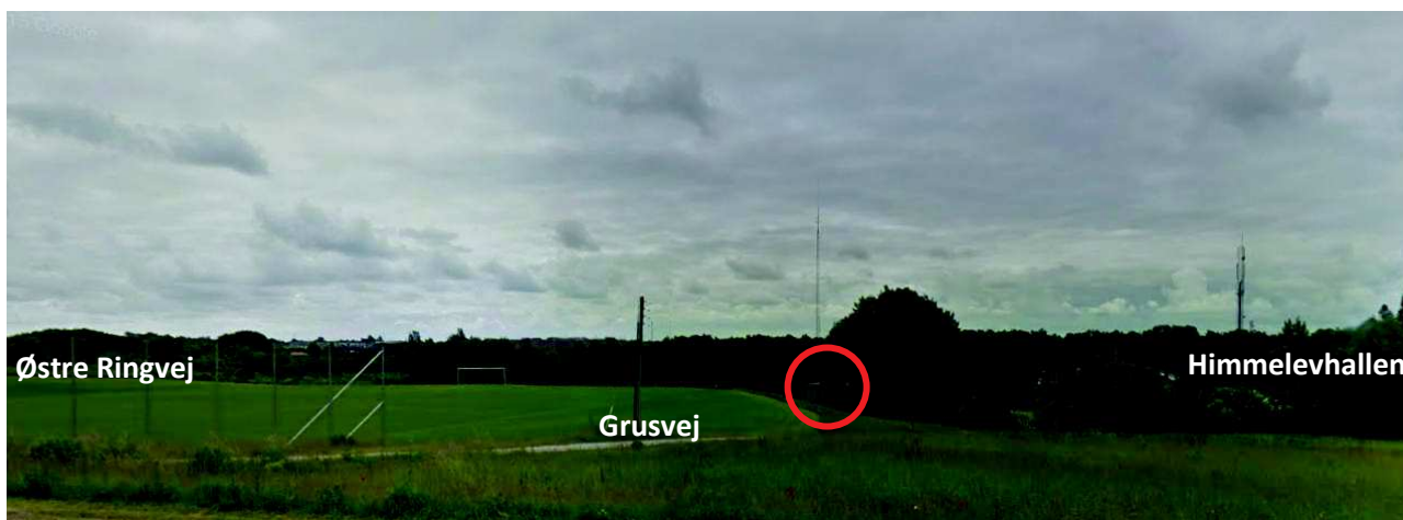
Blik mod gammel lade, set fra Herregårdsvej mod syd-øst