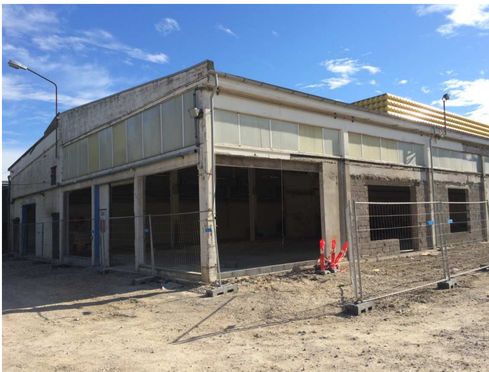
Orangeriet er ved at tage form