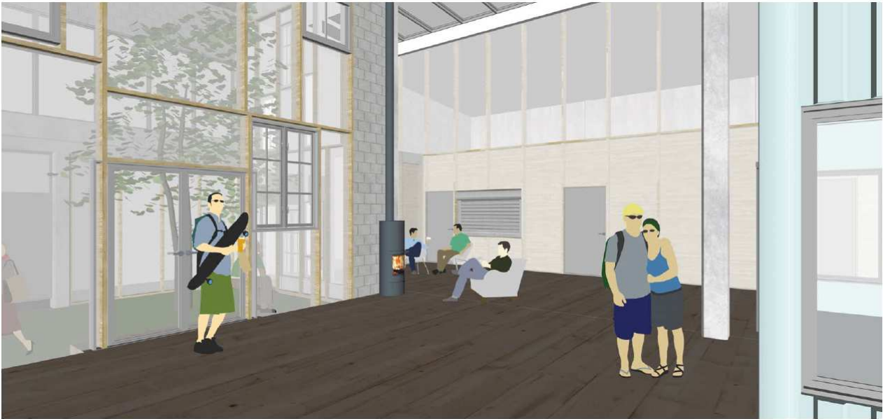
Visualisering af orangeri og opholdsområde med brændeovn og glasparti med genbrugsvinduer