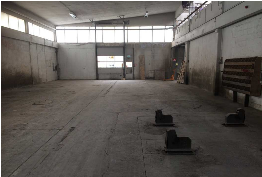
Interiør mod orangeriet, inden hultagning i facaden