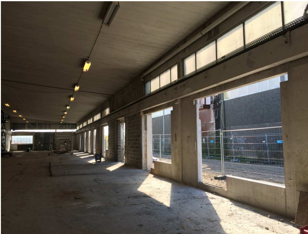
Forberedt til at placere containers langs vinduesfacaden