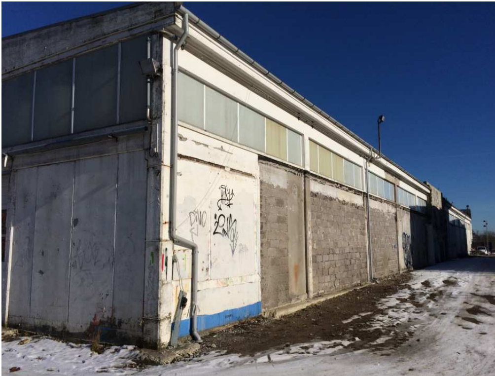
Hjørne mod vest, inden hultagning i facaden til orangeriet