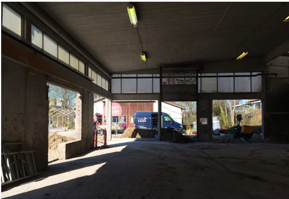
Velgørende dagslys i det samme hjørne