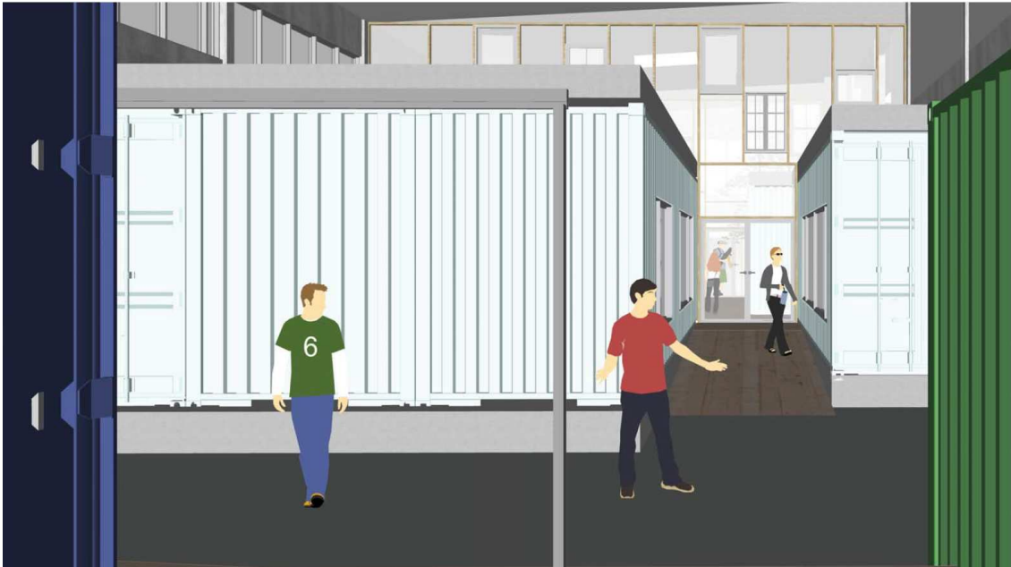
Indgangsområdet mellem Makerspace og People's Corner