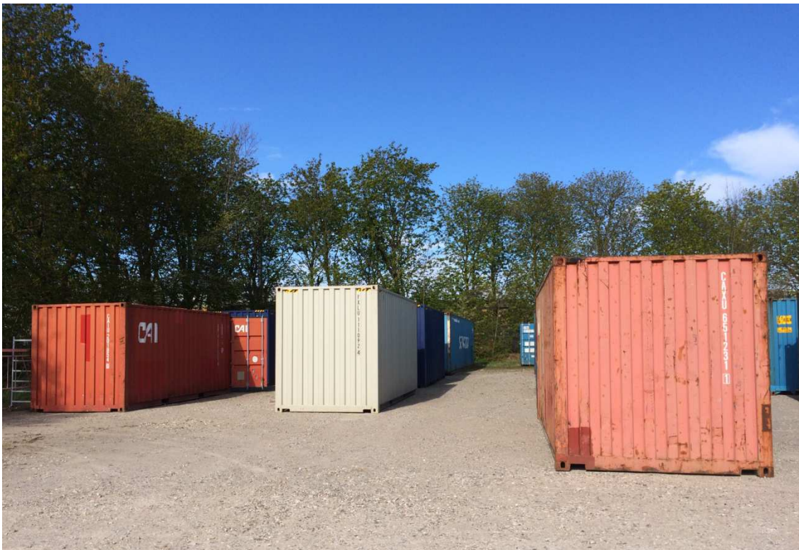
De indkøbte containers i depot i venten på afgang i hallen