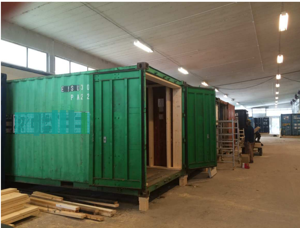
De fleste containers er nu på plads og er ved at indrettes.