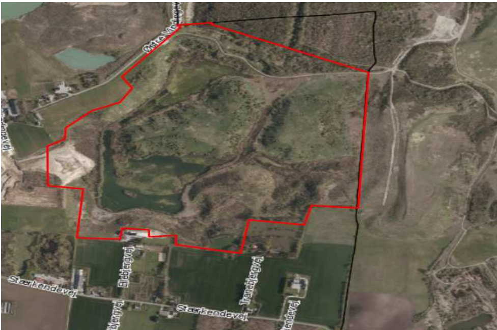
Figur 3: Slutretableret areal med § 3 sø