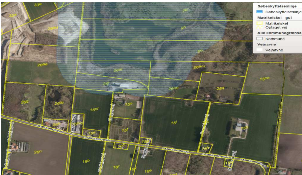
Figur 4: § 3 sø med søbeskyttelseslinje

Der er en ca. 11 ha stor gravesø på arealet i dag. Råstofindvinding og efterbehandling af området blev afsluttet og afmeldt for 14 år siden. Når der ved råstofindvinding er opstået en gravesø, der er større end 3 ha, indtræder der en søbeskyttelseslinje på 150 meter, jf. naturbeskyttelseslovens § 16, stk. 1 (blåt skraveret område i ovenstående figur 4).