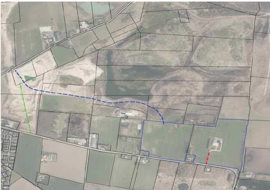
Figur 2. Nymølles forslag til alternative adgangsveje til ansøgt graveområde.

Forslag 3: Via Stærkendevej og tunnel (grøn)